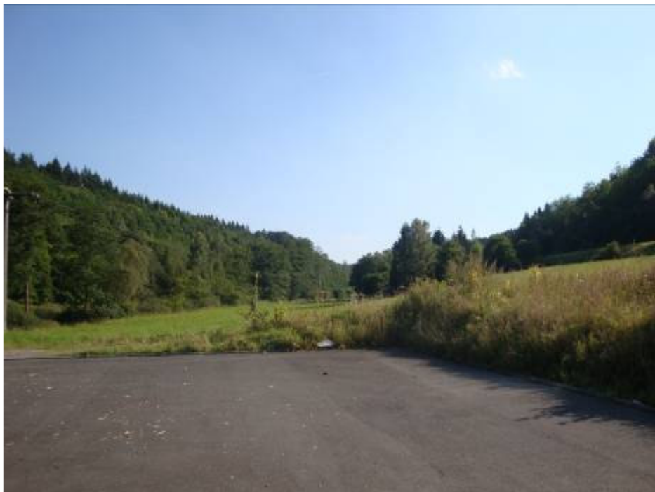
Bild 18: Blick zum Beckenstandort oberhalb des Gewerbegebietes „Aubach“