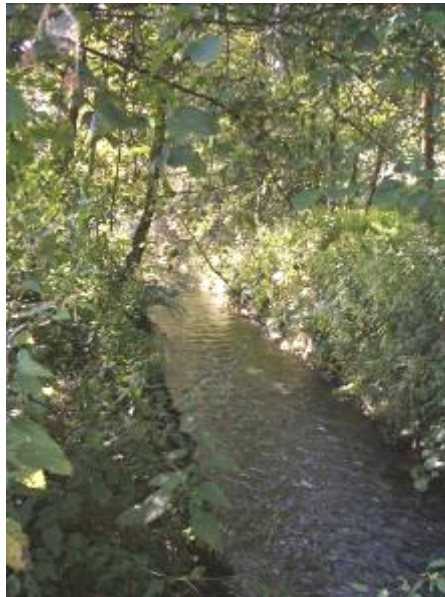
Bild 2: Blick zum linearen und strukturarmen Solmsbach entlang der Landesstraße