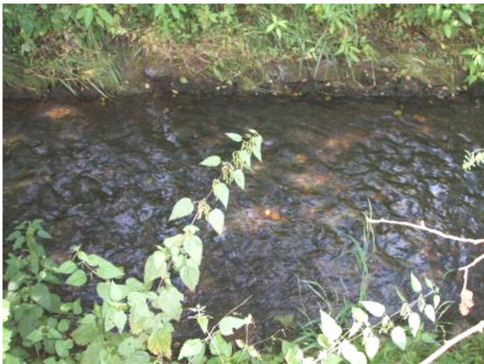
Bild 3: Darstellung der Sohlbefestigung im zuvor genannten Bereich