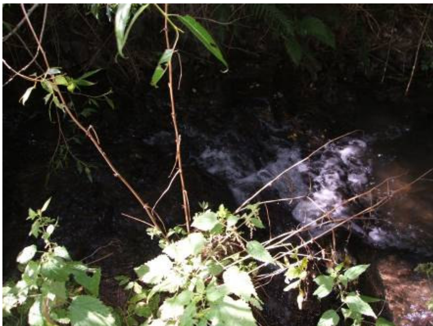
Bild 14: Darstellung eines Wanderhindernisses im Bereich zwischen Brandoberndorf und Weiperfelden