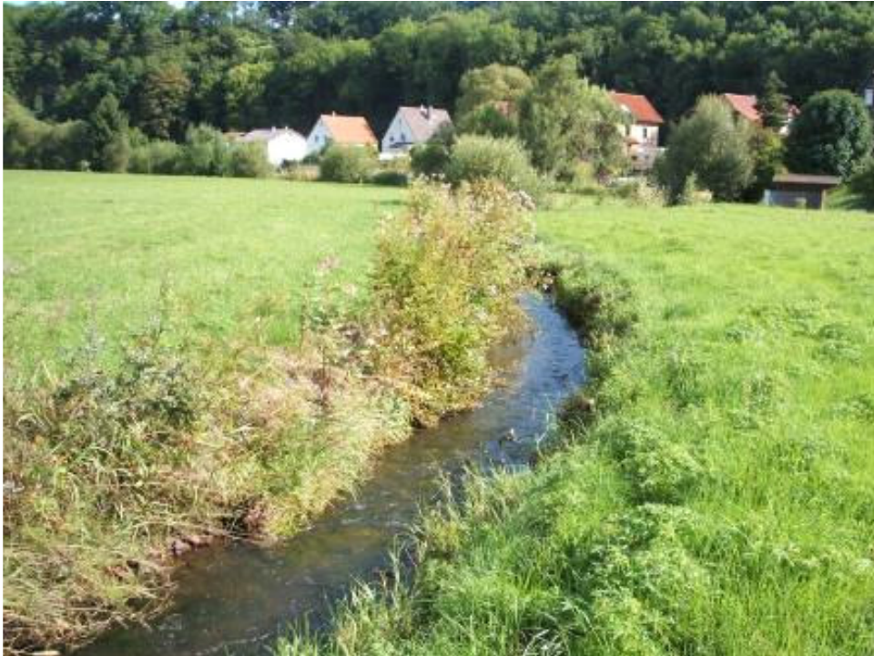
Bild 5: Blick auf den linearen und strukturarmen Abschnitt ohne jegliche Beschattung und Möglichkeit zur Gewässerentwicklung

Feuchtgrünlandes. Dieses würde durch ein artenarmes Ufergehölz mit wenigen dominierenden Neophyten ersetzt werden. Zielsetzung für das obere Solmsbachtal sollte hier auch aus Naturschutzgründen die Weiterführung einer möglichst extensiven Grünlandbewirtschaftung sein. Auch die Folgen auf das Kleinklima sollten berücksichtigt werden.