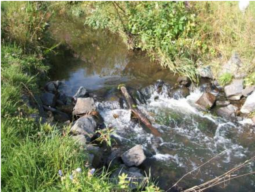
Bild 13: Darstellung eines Wanderhindernisses im Bereich Kröffelbach (Passierbarkeit wurde im Rahmen der Bachbegehung ohne viel Aufwand durch geänderte Anordnung der Steinschüttung verbessert)