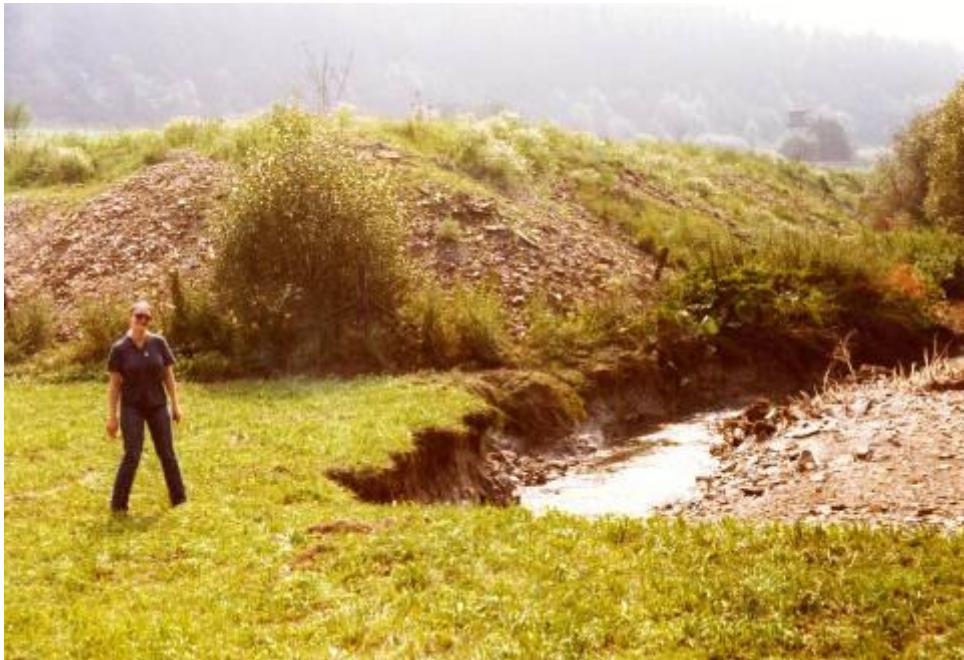
Bild 9: Ausschnitt Solmsbachtal zwischen Weiperfelden und Brandoberndorf nach dem Hochwasser 1981