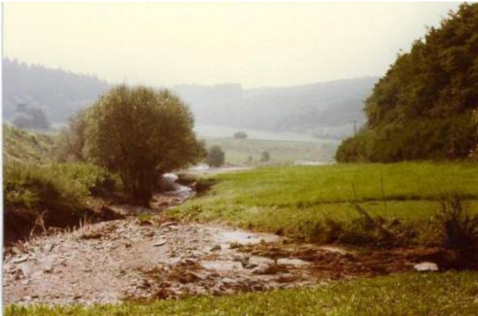
Bild 11: Ausschnitt Solmsbachtal zwischen Weiperfelden und Brandoberndorf nach dem Hochwasser 1981