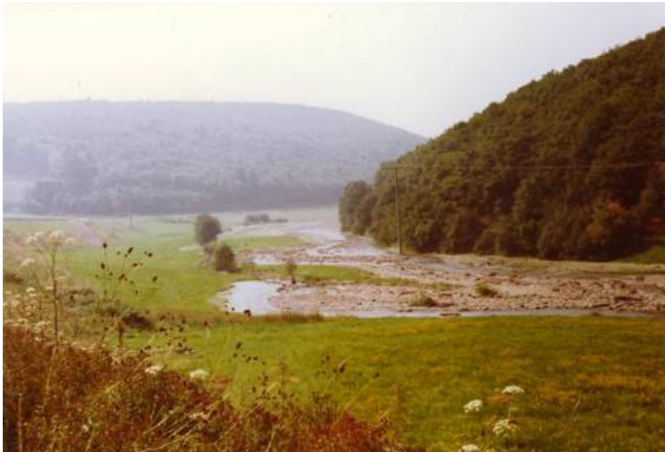
Bild 7: Ausschnitt Solmsbachtal zwischen Weiperfelden und Brandoberndorf nach dem Hochwasser 1981